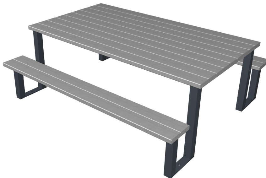
TABLE PRIMAIRE INFLUENCE